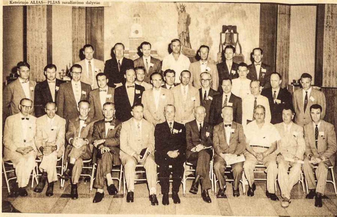
Ketvirtąjį ALIAS—PLIAS susažiovimo dalyviai