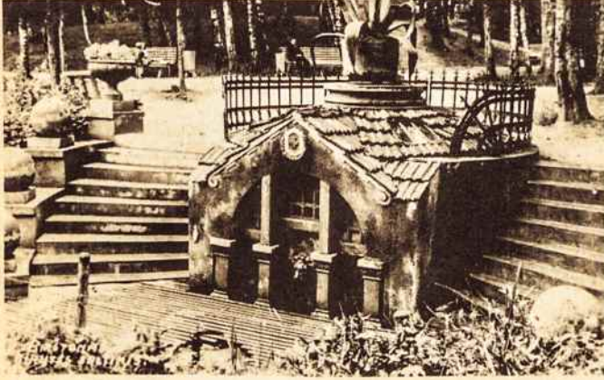
Mineralinis „Birutės“ šaltinis Birštono kurorte. Pastačius užtvanką ties Pažaisliu, šaltinis bus „Kauno Jūros“ užsemtas.

žymėti įdomų Šventosios ties Antaliepte panaudojimo projektą. Ten pasitenkinama nedidele užtvanka giliame slėny ties Ažuoline, aukščiau vad. Velniavos rėvų. Nuo užtvankos daromas vad. derivacinis kanalas deš. šlaitu, kuriuo apie 2 kub. m/s vandens bus atvedamas ligi Antalieptės, ir panaudojamas apie 25 m. kritimas: čia bus galima gauti iki 500 kW energijos, artimoms apylinkėms elektra aprūpinti.