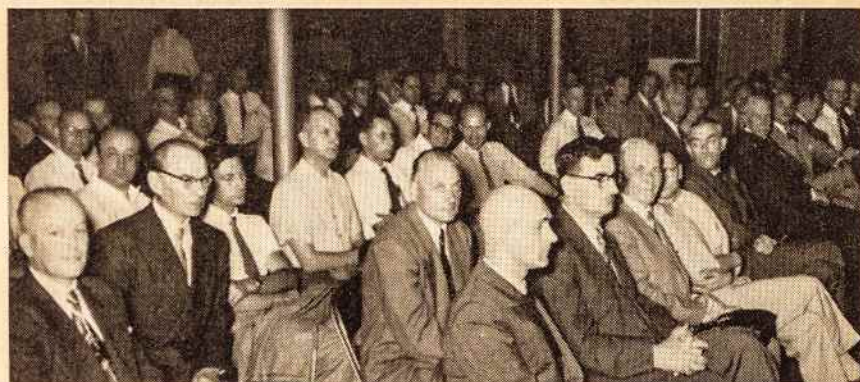
Suvažiavimo dalyviai posėdžių salėje