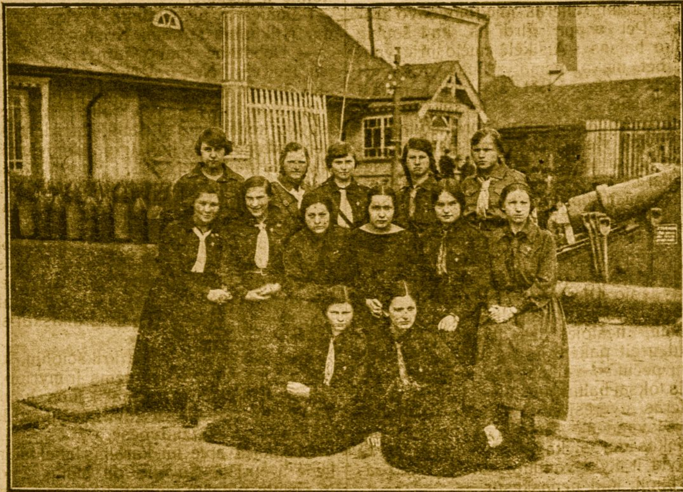
Iš II-jo Lietuvos Skautininkų—Instruktorių suvažiavimo Kaune, įvykusio š.m. balandžio mėn. 24—26 d.

PASTABA. Lietuvos skautai nedalyvavo rungtynėse. Lietuvos draugovė, kaip daugelio kitų šalių draugovės, buvo Jamboree švečiu.