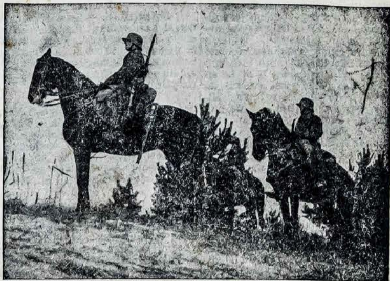
Gimtinių laukų sargyboje.

Rusijoje karas jau visiškai prie-galo. Baigiami naikinti paskutiniai „nenugalimosios armijos likučiai. Ateinančioji savaitė atneš daug di-desnių staigmenų Stalinui ir jo krau-gerių kamarilei. Rusija bus išvaduo-ta iš kruviniausios diktatūros, o pa-saulis — iš tarptautinės žydijos, čeko-s ir agitatorių, kurie knisa kiek vienos laisvos valstybės pamatus.