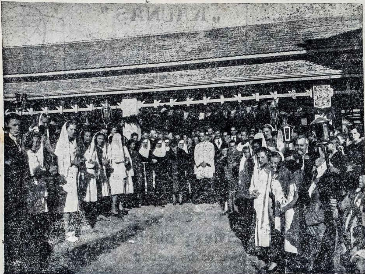
„Sau paminkla stačiau Užu vario tvirciau. Jo nei lietūs grauzys Nei iptykės siaurys Neistengs sunaikint, Nezinion nuskandint“