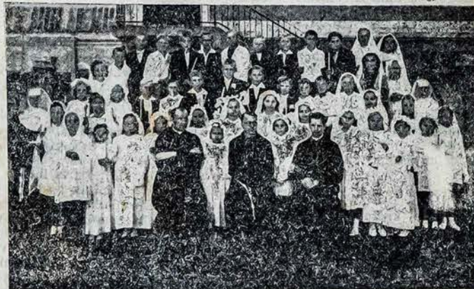
MIESTO LIETUVIUKŲ PIRMOJI KOMUNIJĄ.

Alytaus apylinkės, kur įvyko kovos teikia labai liūdną vaizdą. Miškai išdegti, didžiausios duobės suraustos vokiečių granatų, kas žingsnis rikso sunaikinti rusų tankai.