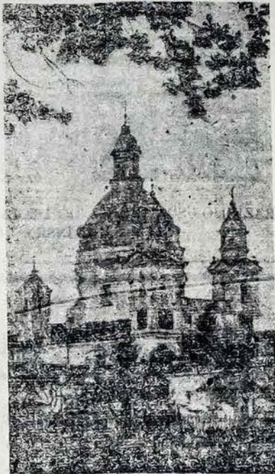
GRAŽIOSIOS LIETUVOS BAŽNYČIOS.