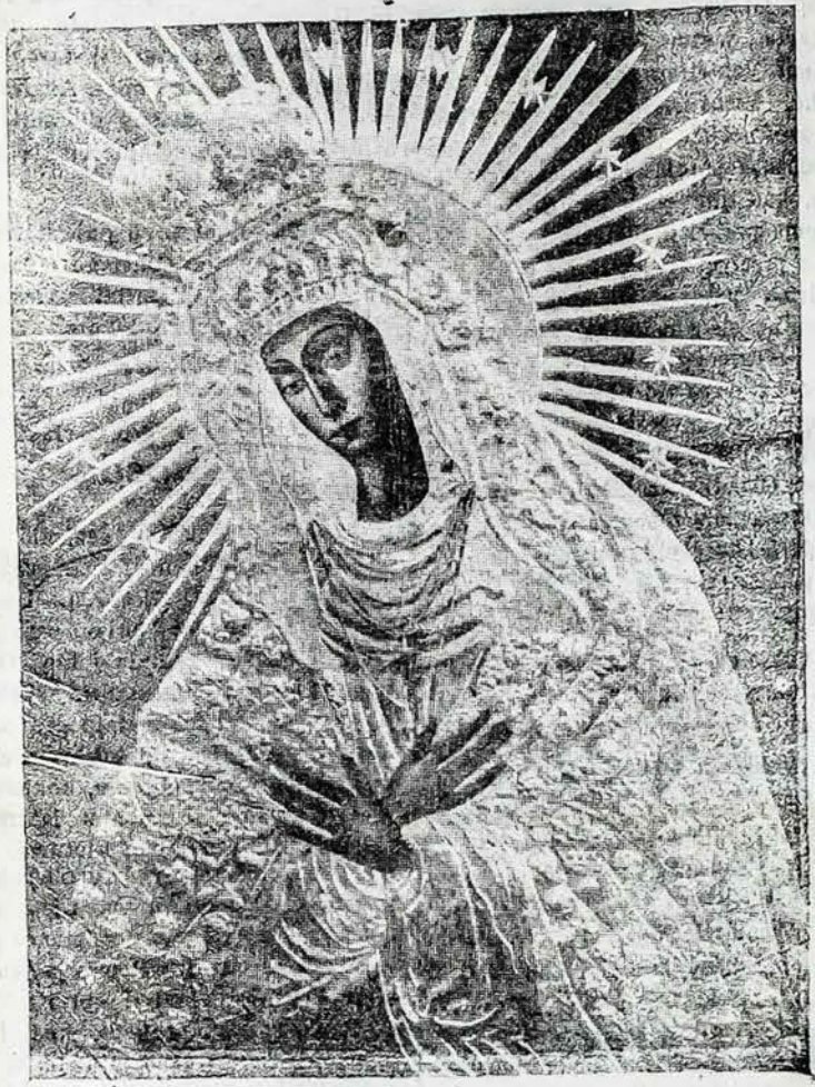
Aušros Vartų Marija, Vilniuje.

Penktadieni Lietuvos kariuomenė vedama brigados generolo Vitkausko pradėjo užimti Vilniaus kraštą. Pats Vilniaus miestas bus užimtas ši šeštadieni 13 val. Vilniaus krašto užėmimas truks keturias dienas. Laikinai Vilniaus valdytoju paskirtas Merkys, buvęs Klaipėdos Gubernatorius.