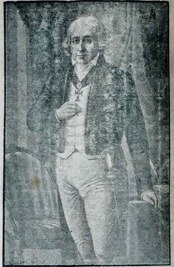
José Bonifacio, Daug pasidarbavęs savo tėvynei.