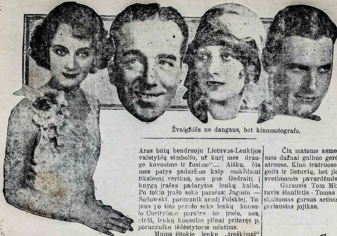
Žvaigždės ne dangaus, bet kinomotografo.