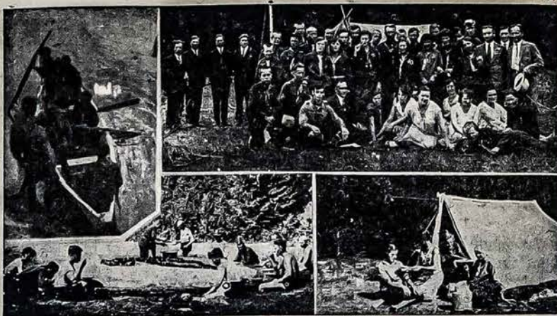
Linksmas ir malonus buvo Nepriklausomoje Lietuvoje.