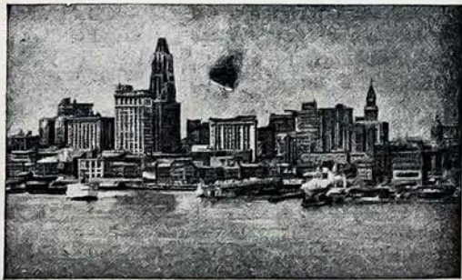
Chicago miesto vaizdas — Šiaurės Amerikoje.

Taip reikalinga gera siuvėja su prakti- ka prie masinių siuvi- mo. Skubiai teirautis „LIETUVIO“ redakci- joje.