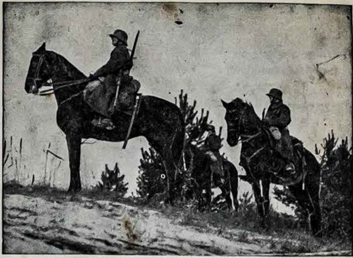
Buv. Laisvosios Lietuvos žvalgai.

Lietuvos miesteliuose ir kaimuose slankioja črezvičiai kės agentai ir klausosi, ką žmonės kalba. Jei kas garsiau išsitarla prieš raudonąjį režimą, tą tuojau suima. Tie agentai yra daugiausia žydai.