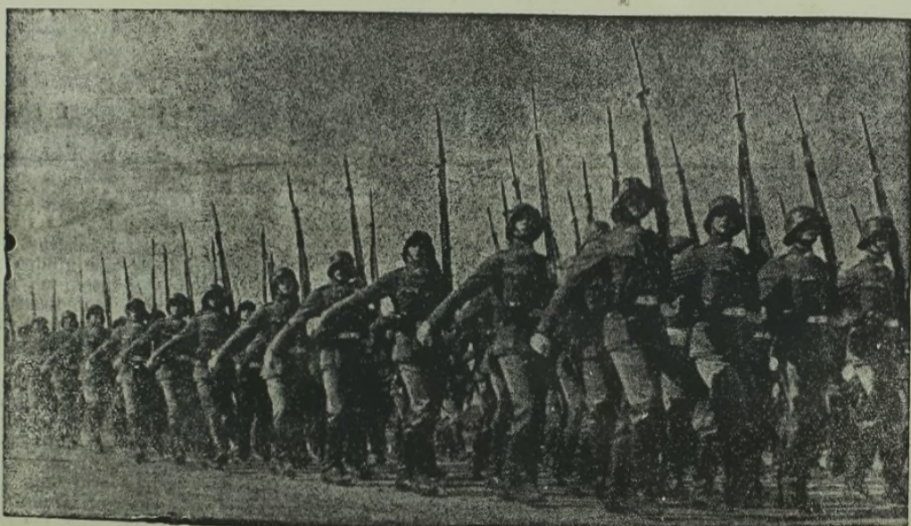
O čia žygiuoja jau laisvosios Lietuvos Kariuomenė.