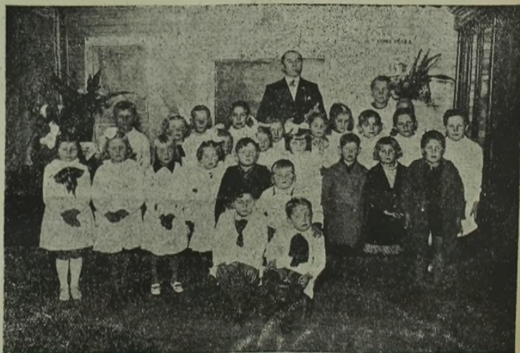
Prez. A. Smetonos vardo lietuvių mokykla Berise, Argentinoje.