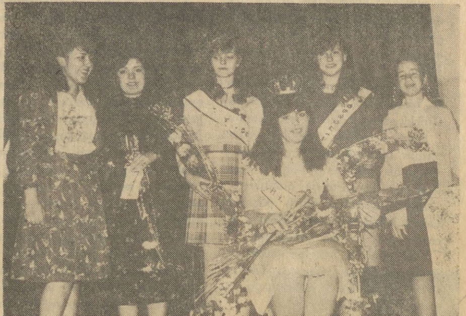
Argentinos Lietuvių Centre surengto Pavasario 81 sutikime, 20. 9. 81.