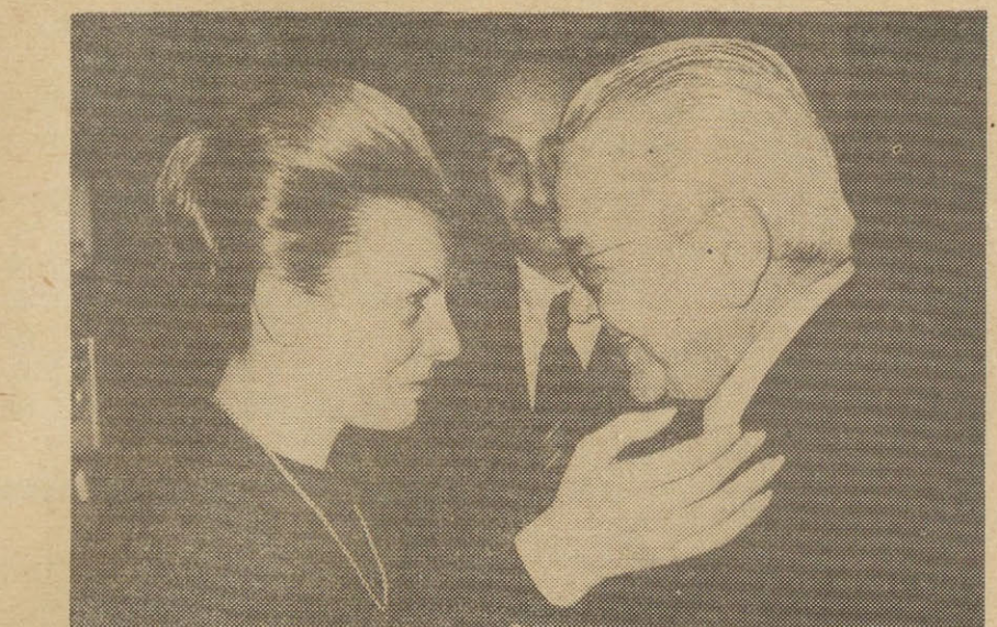
Dr. Ricardo Balbin, žymus teisininkas, ilgus metus vadovavęs Radikalų partijai, neseniai miręs, nuotraukoje su buv. prezidente Isabel Perón.

Ar jis sugebės įvesti tvarką parodis ateitis.