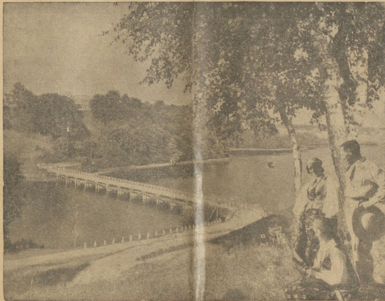
Žavėtinai Dubingių ežero vaizdas. Gal nevienam iš mūsų teko juo pasigrožėti gyvenant Lietuvoje.