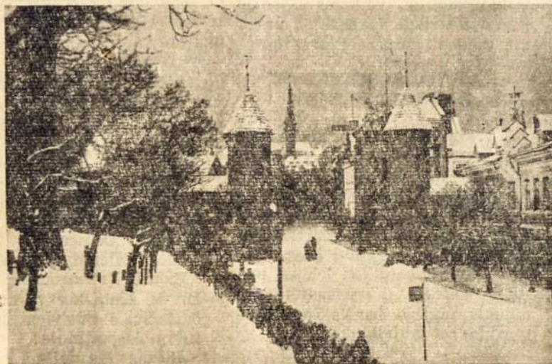
Mūsų Pabaltijo sesuo Estija savo Nepriklausomybę paskelbė 24. 2. 1918. Dabar Estija, kaip ir Lietuva su Latvija, yra bendro priesio pavergta ir sykiu su mumis kovoja už savo tautos ir bendrą Pabaltijo tautų išsilaisvinimą. Vaizduose: Kairė — Estijos sostinė — Talinas; dešinė — universitetas Estijos miestas Tartu, bolševikų išgriautas 1941 metais.