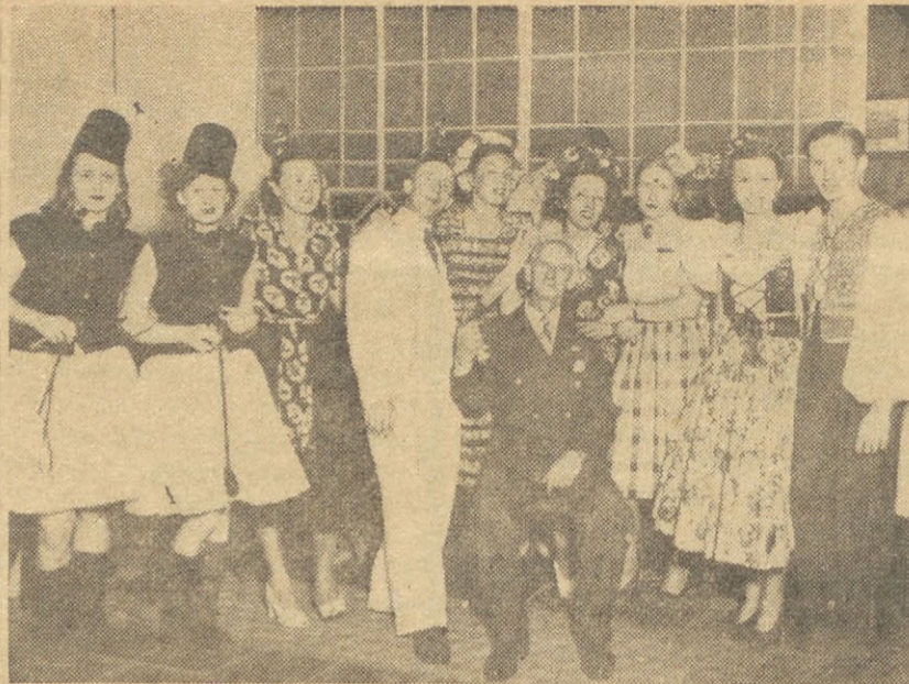
Vienas iš daugelio vaizdų, nufotografuotų karnavaliu metu Lietuvių Klūbe. Paveikslus galima gauti Balse.

JOSE E. URIBURU 770 — T. A. 47, Cuyo 4970 — BS. AIRES (Altura: Córdoba 2200)