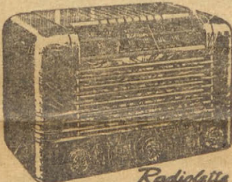
Radiolite RCA Victor Modelo 51-X-1

BARŽDŽIUS ir TOSCANO, sav. Av. SANTA FE 3870. T. A. 72-2529 Radio aparatai, budėtojai, laikrodžiai, elektros reikmenų pardavimas. Pašaukus einame į namus taisyti radio aparatus, gazines ir elektros virtuves ir kitas mašinas.