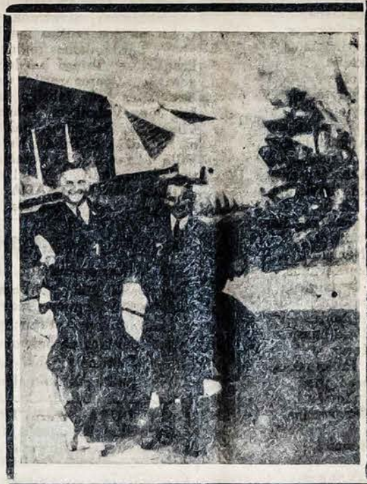
Amerikos lietuviai Steponas Darius (kairė) ir Stasys Girėnas, kurie perskridę Atlantą zuvo ties Lietuvos siena, Pomeranijos miškuose 17 - 7 - 33. Jų atminčiai įsteigta Išeivių Diena Argentinos lietuviai didingai mini „J. Verdi“ teatre 17 - 7 - 38.

SEKMADIENYJE, LIEPOS - JULIO 17 d., 1938