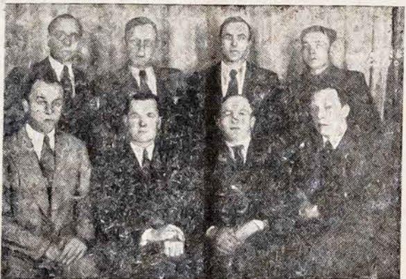
URUGVAJAUS LIET. „VIENYBĖS“ VADOVYBĖ

Metinių įkurtuvių organizavimas pavestas išrinktai komisijai,