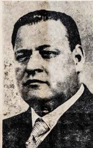
S. E. Dr. Roberto M. Ortiz Presidente de la Nación

El veterano de la prensa lituanu en la América del Sud — La Voz de los Lituanos en la Argentina, — representando a unos 30.000 lituanos en la República Argentina, dedica estas estrofas a la conmemoración de la Fiesta Patria y al mayor acercamiento hacia la colaboración intelectual argentino - lituanu.