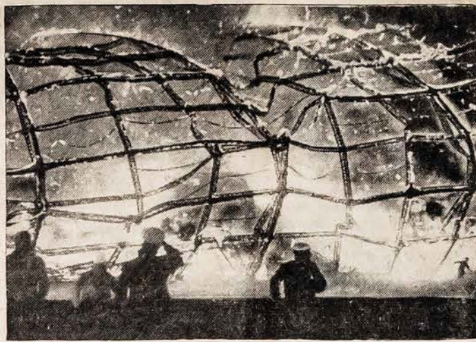
Baigiantis liepsnot „Hindenburg“ Lakehurst aerodrome

Staiga pajutau, kad šalia manęs nebėra mano žmonos. Atsigrežiau, ir liepsnos ir nuodingi dūmai su garais smogė į veidą. Pamačiau savo žmoną išsitiesusią išilgai ir nebejudančią ant žemės. Rodos nuplaukiau prie jos ir patraukiau ją viršun. Paskui ją pastūmiau ir pastebėjau, kad ji lyg užsukta mechaninė lėlė vėl pradėjo bėgti. Ją bestumdama pats pavirtau. Guldama ant aliejum persunktos degančios žemės jaučiau, kad esu atėjęs prie tikslo. Žinojau, kad tai reiškia, kad mirštu, bet tatai buvo toks malonus jausmas, išsitiesti ir laukti mirties, kad ta mintis manęs nei kiek nebaugino. Atsiminę pakėliau galvą pamatyti, ar mano žmona saugi,