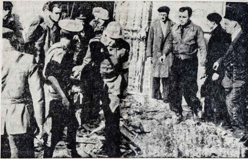
Šiame paveiksle matome renkant lavonus ir sužeistuosius orlaivių antplūdžio. Gyvenimo ironija: Karas nepaskelbtas, o kasdien Ispanijos laukuose ir miestuose tūkstančiai nekaltų žmonių verčiami lavonais ir invalidais

Maskvos „Pravda“ 7 - 2 - 38 plačiu editorialu komentuoja Hitlerio diktatūros siuntimą ir pabrėžia, kad atmainos Vokietijos generaliniame štabe reiškia karo pavojaus artėjimą.