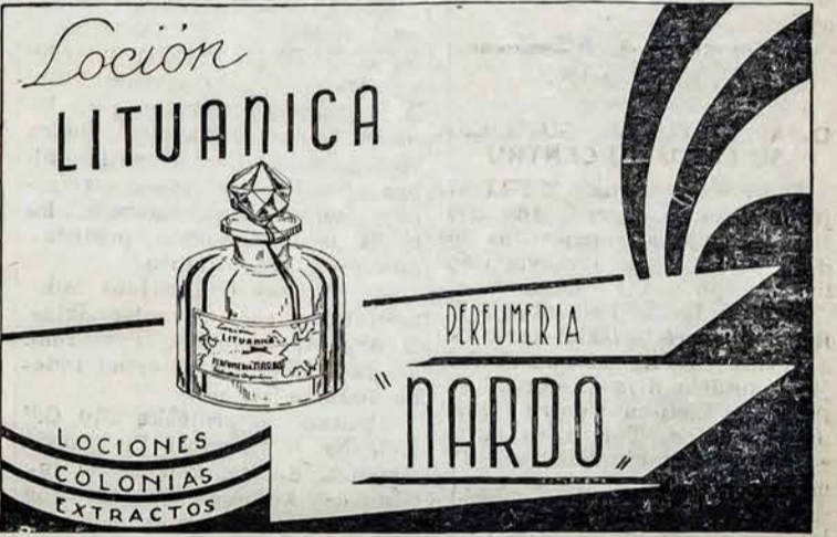
K V Ė P A L A I, KURIUOS VARTOJA VISI LIETUVIAI

"Argentinos Lietuvių Balso" Kalendorius 1938 metams yra vienintelis Argentinoje leidžiamas lietuvių Kalendorius.