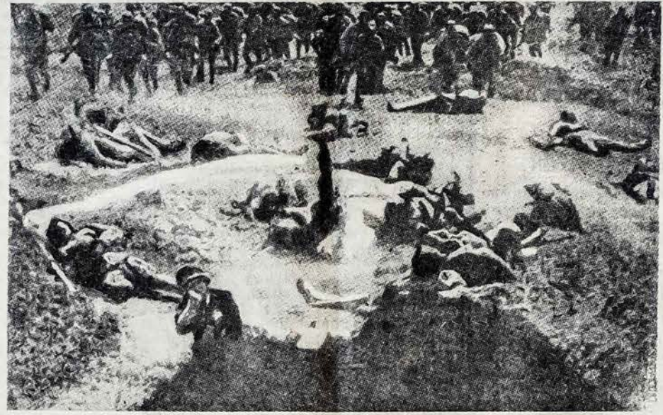
Kinijos žemė nuklota Kinijos kareivių laborais. Daugiausia kiniečių žūsta nuo juos puolančių japonų kulkosvydžių ir nuo iš aeroplanų metomų bombų.

„Argentinos Lietuvių Balso“ kalendorius 1938 metams jau gatavas. Užsimekėjusiems už 1938 metus ekspeduojamas sekanti savaitė. Atnaujinkite prenumeratas nedelsdami, kad Jūs ir Jūsų namiškiai Lietuvoje gautų kalendorių Naujiems Metams. Šį sekmadienį, 12-12-37 dar „šilta“ kalendorių galima atsiimti asmeniškai „A. L. Balso“ Administracijoje, Independencia 2706, nuo 15 iki 19 val. Užprenumeruojant „A. L. Balso“ savaitės Lietuvon dabar, kalendorius Jūsų namiškius pasieks švenčių metu.