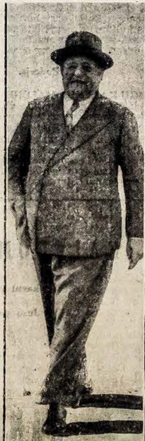
— Dr. R. M. Ortiz, kuris dalyvaujant 27 senatoriams ir 85 parlamentonariams, susirinkusiems kongrese 25.11.37 tapo proklamuoatas Respublikos Prezidentu, kaip pereinamo rinkimuose išrinktas 1938 — 1944 metų periodui. Prezidento vietą Dr. R. M. Ortiz užims vasario 20, 1938. Tam pat periodui viceprezidento vietą tą dieną užims Dr. Ramón S. Castillo.

— Trenque Lauquen mieste 28-11-37 pasibaigė La Pampa ir Buenos Aires provincijos žemės ūkio draugijų 13-tasis kongresas.