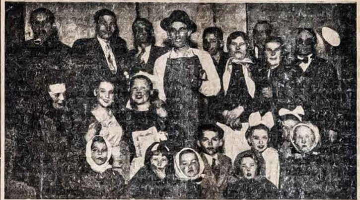
Susivienijimiečių artistų grupė, laike vaidinimo „Užburto Kunigaikščio“, pastatyto „La Perla“ teatro scenoje.

Įžanga vyrams $ 1.00; ponioms ir panelėms tik $ 0.50.