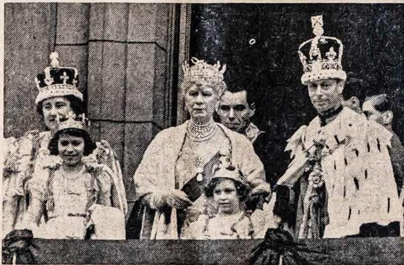
Šiame paveiksle matome ne karnavalo vaizdėlį, bet Anglijos karalių Jurgį VI su motina Marija, žmona Elzbieta ir k'ia „svita“ Buckingham palociaus balkone po karunacijos Londone.