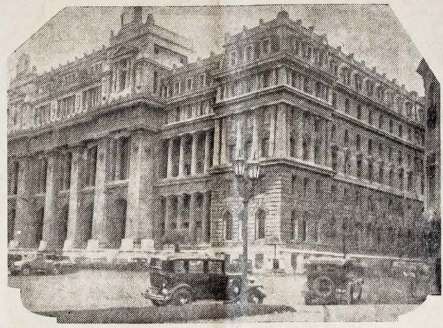
BUENOS AIRES Miesto vaizdai. — VYRIAUSIOJO TRIBUNOLO RŪMAI, Palacio de Justicia, — milžiniška įstaiga, kuri randasi prie Plaza Lavalle

— Venezueloje tęsiasi streikai dėl valdžios išleisto naujo darbininkų organizacijos varžančio dekreto. Macaibos mieste paskelbtas generalinis streikas.