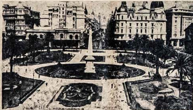
PAČIAME BUENOS AIRES Miesto centre, aikštėje 25 de Mayo, stovi istoriškas Argentinos Respublikos Nepriklausomybės paminklas, gražiai prižiūrinamas, gelėmis apšodindamas. Visiems jis primena Gegužės 25 dieną, 1810 metus. Plaza de Mayo dabar aplink apaugo aukštais mūrais, pati aikštė kelis kartus pertvarkyta, bet paminklas paliekama senoviškas, kuris primena anų laikų Argentinos sūnų kovas už laisvę.

sio ispanų ir anglų laivynus ir apgynusio Argentiną nuo naujų invazijų. Argentinos Nepriklausomybės kovotojas sausumoje yra generolas San Martin , kuris iškovojo laisvę ne tik Argentinai, bet taipgi Čilei ir Perū. Gimė (San Martin Argentinos Yapeyū vasario 25 d. 1778, mirė Prancūzijos Bolog-