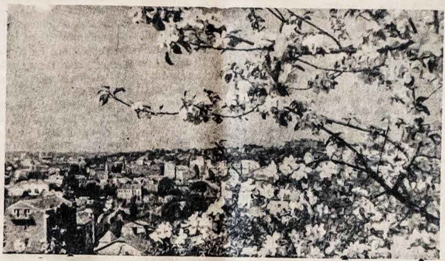
PAVASARIS LIETUVOJE. — GEGUŽES MĖNESYJE JAU VISA LIETUVOS GAMTA ŽALIUOJA, BALTA ŽIEMOS RŪBĄ NUSIMETUS. Raudonais ir baltais žiedais pasipuošę sodai, kur prieš saulėtekį lakštingala čiulba ir mūsų broliai artojai vargo dainas dainuoja. Mūsų paveiksle matomas žydinčių obelių vaizdelis yra iš Kauno priemiesčio.

— Urugvajaus valdžios mokyklose 10.V.36 kalbomis ir koncertinėmis programomis buvo paminėta "Tėvo Diena".