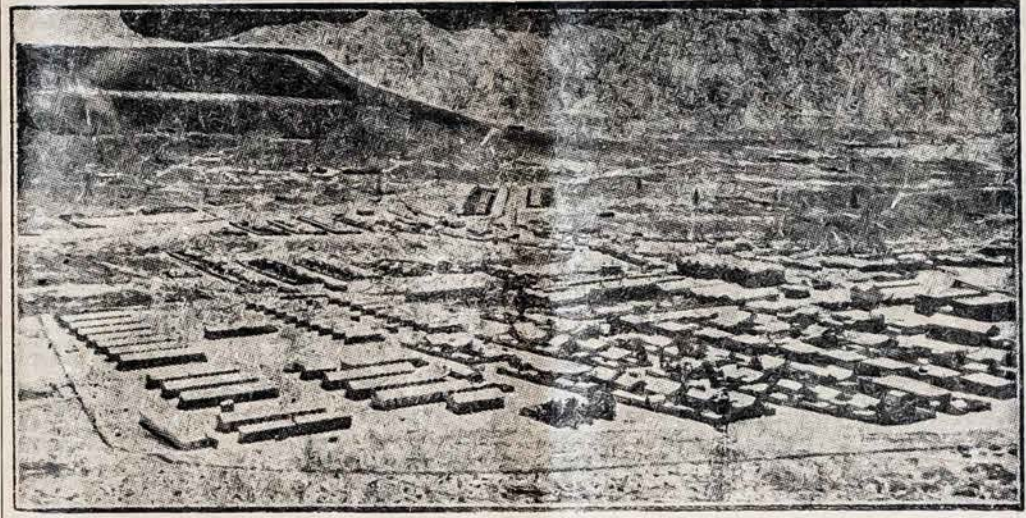
Juodojo aukso šaltiniai. — Šiame paveikslėlyje matome Argentinos valstybinės petroleo industrijos instaliacijas Patagonijoje, netoli Comodoro Rivadavia. Tai Yacimientos Petroliferos Fiscales turtinga petroleo zona, apstatyta barakais. Šioje vietoje dirba didokas skaičius lietuvių — "Argentinos Lietuvių Balso" skaitytojų.

— Ispanijos parlamentas 195 balsų dauguma pareiškė pasitikėjimą Azanja ministerių kabinetui. Prieš balsavo tik keli išsigimę monarchistai, kurių dienos Ispanijoje baigiasi.