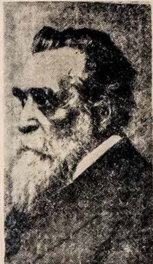
Dr. JONAS BASANA VIČIUS, hombre de ciencia y letras, profeta de la Independencia de Lituania, murió en Vilnius el día 16 de Febrero, de 1927.

Los treinta y cinco mil lituanos, que habitan en tan hospitalaria República Argentina, llegaron de las orillas del mar Báltico. Los lituanos con su idioma independiente, relacionado al sanscrito y más parecido al latino que al