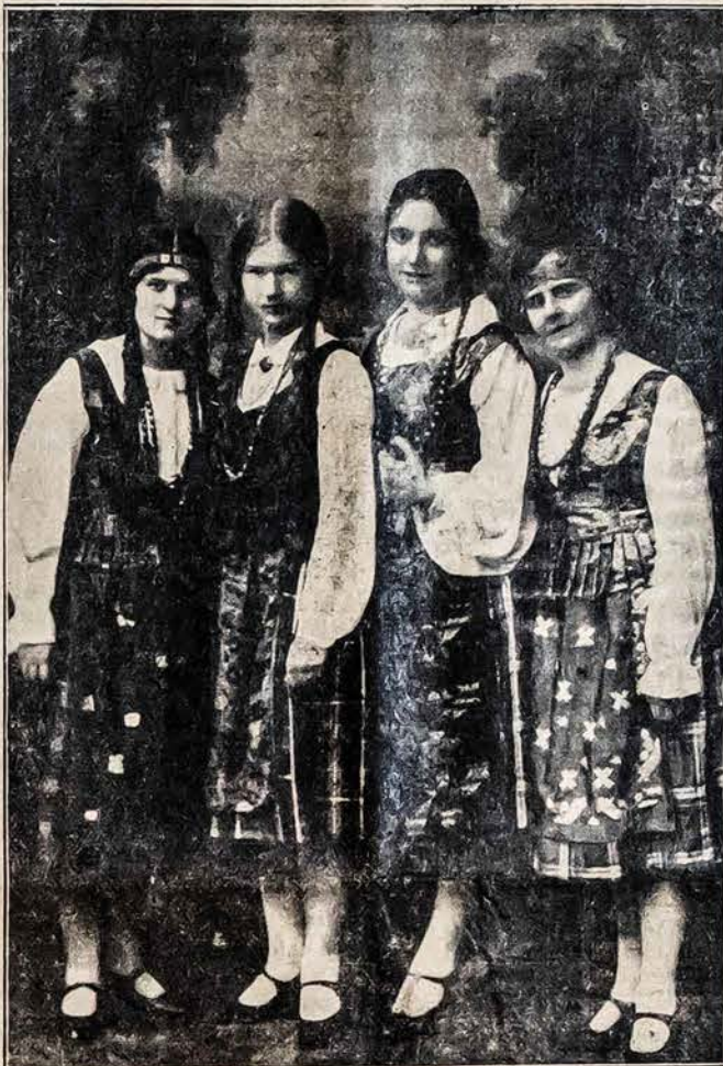
Mūsų sesutės Lietuvoje šiandien šitaip pasipuošusios Nepriklausomybės šventę mini.

tik ką atvykęs iš Lietuvos nau- jas Lietuvos Atstovybės sekre- torius, kuris kalbės balsiečių iškilme Jose Verdi teatre šį šeštadienį.