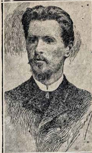
Dr. VINCAS KUDIRKA, escritor, autor del Himno Nacional de Lituania, mártir de las luchas de Independencia, murió el día 16 de Noviembre, de 1899.

miles de estudiantes en la Universidad de Estado, en la Academia de Agricultura y Escuela Superior de Bellas Artes. El teatro de Opera de Kaunas, sostenido por el Estado, es uno de los mejores teatros de Europa.