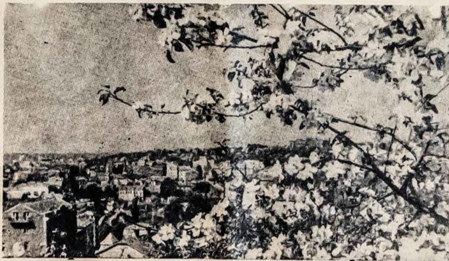
Lituania — país del ambar y nieve. Nuestra fotografía representa la manzana floreciente, en el jardín del campesino lituano, cerca de Kaunas.

Los gobiernos de los zares establecieron esclavitud en Lituania. En el año 1864 prohibieron el idioma lituano, quemando libros, cerrando escuelas y persiguiendo a los que luchaban por la independencia. Historia de Lituania conoce muchos mártires, que eran fusilados, ahorcados y desterrados a Siberia.