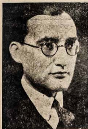
Sr. STASYS LOZORAITIS, Ministro de Relaciones Exteriores de Lituania.

Elavo, desde los tiempos muy remotos habitan en su patria. Ellos son primeros habitantes de las orillas del mar Báltico, y de los ríos Nemunas, Vilija, Dubysa, etc. Eran los lituanos que establecieron su antigua Capital Vilnius, el puerto de Klaipėda y Kaunas. Hace algunos ochocientos años Lituania era uno de los países más