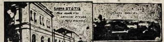
Lietuviška fotografija FOTO ANTONOFF C. Defensa 493 Telefonas 33 — 1365