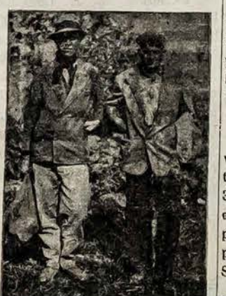
Šiedu vyrai yra lietuviai bedarbiai. Iš pasikalbėjimo su jais paaiškėjo, kad iš Lietuvos pasiturinčių ūkininkų sūnūs, kurie nesutikdami su tėvais išvyko į pasaulį laimės ieškoti. Neradę laimės ir netekę darbo, likimo priversti eiti po miestą kalėdoti arba iš atmatų dėžių rinkti sau maistą. Čia matome su maišais grįžtančius iš miesto į Palermo ūko žolynus kur jie gyvena ištisus metus po atviru dangumi.

Ispanijoje, Viana miestelyje būrys asmenų vienoje aikštėje iškėlė monarchijos vėliavą, šaukdami šalin respubliką! Atvykęsi policija įvedė tvarką, areštuodama svarbiausius kaltininkus.