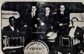
Orkestras „LYRA“, kuris Gruodžio 9 d. Grieš Berisiečiams.