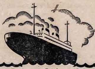
P. A. Isteigtas 1911