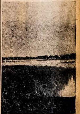
Ezeras netoli Kol. Malbrano

ir linksmą panoramą. Salado upėje randasi daug žuvų, tokio būdu užtikrintas maisto įvairumas. Ir tuo pačiu laiku tas suteikia progą žvejybos mėgėjams.