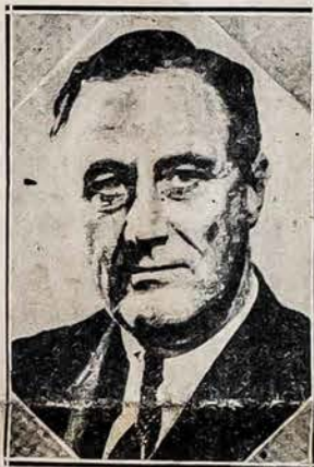
Franklinas Rooseveltas, naujas Jungt. Amer. Valst. prezidentas. tatų, kurių tačiau nė vienas nepasiekė savo tikslo.

Kaip jau skaitytojams yra žinoma, prieš Rooseveltą gyvybę nese niai buvo padaryta net pora aten