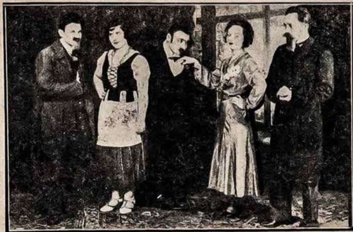
SCENA IŠ VEIKALO „PATRIOTAI“

Į Penkiolikos metų Lietuvos Nepriklausomybės paminėjimą kuri rengia,