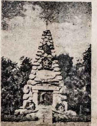
Paminklas žuvusiems už Lietuvos nepriklausomybę kariams.

Iš Londono praneša, kad Olandijos karalienė Vilgelmina, kuri dabartiniu laiku randasi Šveicarijoje, del vykstančių Olandijoje neramumų, nutarė grįžti į Olandiją. Ypač smarkus judėjimas jaučiamas karo laivyne ir kariuomenės dalyse.