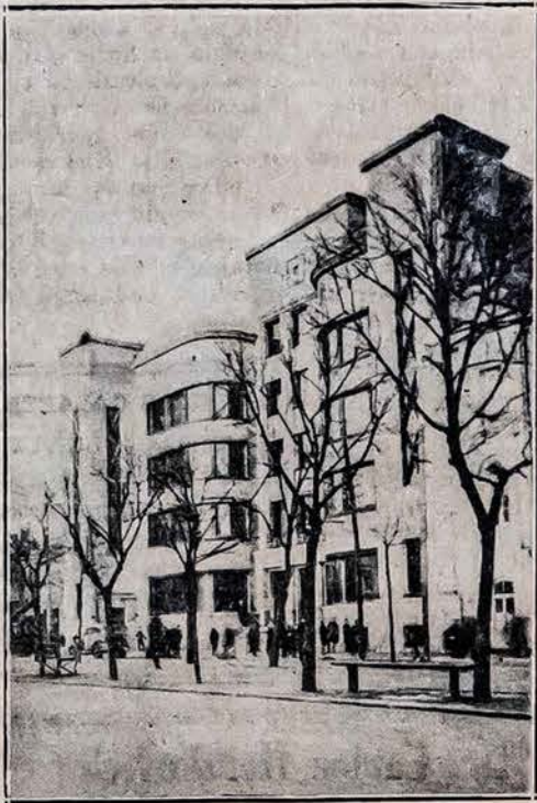
NAUJI KAUNO PAŠTO RŪMAI.

Krizis palietė net neseniai įvykusį Kaune Tautininkų suvažiavimą. Susirinkusieji, išklausę aukštų asmenų pranešimą apie diktatūros reikalingumą ir parlamentarizmo žalingumą Lietuvai, pradėjo lyg nerimauti, o asmenims, išdrįsusiems pareikšti susi-