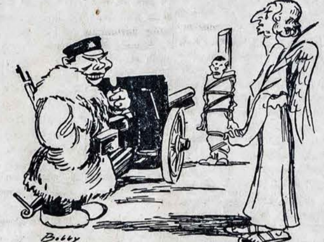
TAUTŲ SAJUNGA: Nustok gi kartą kankinę tuos vargšus kinus. JAPONAS: Juk aš tik ginuos.

Nairobi (Indija). Generalinis gubernatorius pakeitė mirties bausmę kalėjimu nuo 3 metų iki 3 mėnesių, 60 asmenų tautelės "Wakamabe", kurie pagaliais užmuše vieną senutę - būrininkę. Tokį užmušimą pateisina tos tautelės paprotys.