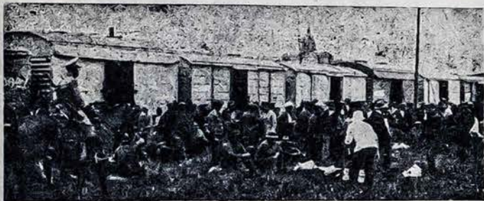
NAUJO UOSTO BEDARBIŲ DALIS

Todėl visais galimais būdais turime gelbėti savo brolius, tuos kurie tapo nedarbo išmesti į patilčius ir žolynus. Rinkime aukas ir aukokime kas ką gali pinigų, drabužių, maišus ir visa tai ko jiems trūksta. Aukų rinkime nesusipratimams išvengti, draugija „Lietuva“ turėtų paskirti miesto rajonų aukų suėmėjus su tam tikrais draugijos ir valdžios įgaliojimais ir aukų lapais. Atminime, jog šiam prakilniam darbui užjaučia ir vietos gyventojai. Panašiai sutvarkius aukų rinkimą geriau žiūrėtų ir patys lietuviai. Pasitenkint vien dr. „Lietuva“ bedarbių šelpimo komisija ir jos darbu būtų permaža. Pasakymas „aukas siųskite arba neškite dr. „Lietuva“ yra per daug „šleketnas“.