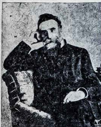
Dr. J. BASANAVIČIUS.

Lietuvos atgimimo ir spaudos laisvės atgavimo Tėvas.