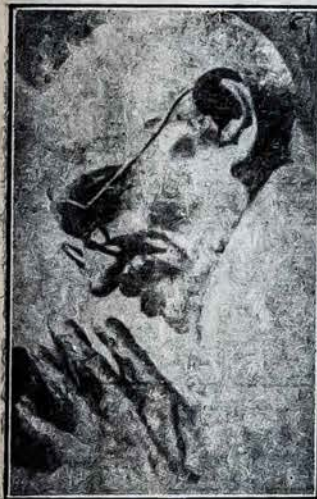
Mahandas Karamchand Gandhi

hatma" kas reiškia "didelė siela". Gimė spalio mėn. 1869 met. Porbandare, Omano jūrų pakrastyje. Pacina iš turtingos ir kilnios šeimos kuri priklausė tikiybinei sektai "Jai", ir kurios pagrindinis principas yra "ahimsa" arba pasyvumas.