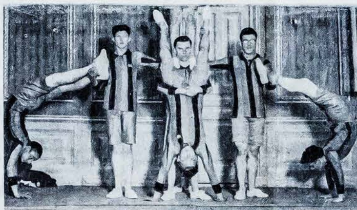
Sporto sekcijos dalyviai piramidžių pratimo metu

Tad matosi S. S. užsibrėžtame darbe daug naudingų dalykų jaunimui ir nieko nėra kas nebūtų galima. Tad, jaunuoliai, kurie dar neprisirašė, tuoj nelaukdami nieko užsirašykite į Sporto Sekciją.