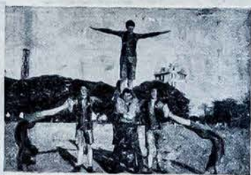
D-jos „Lietuva“ Sporto Sekcijos Dalyvių Grupė. — c. Patricios 767 BUENOS AIRES

Balandžio mėn. 11 d. gatvėje O. Gorman 108, salione „Libera Italia“ Lietuvių Susivienijimo vakarėlis.