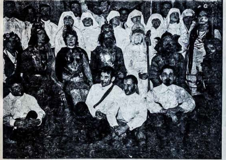
„KUNIGAİKŠTIS RINGAUDAS“.—Dalis šio veikalo vaidintojų.