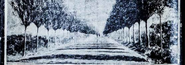
Šitas kelias eina pro pačią Koloniją

Jūs galite pirkti geros, derlingos žemės Lietuvių Kolonijoj, Mendozos provincijoj, po 30 pesų už hektarą. Imokėdami tik 200 pesų už 50 hektarų, kitus galėsite išsimokėti per 10 metų. Ten pat gausite