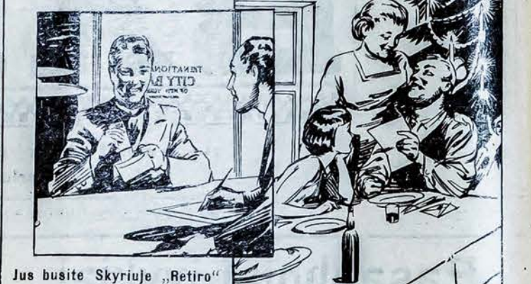
Jūs busite Skyriuje „Retiro“ aptarnaujami skubiausiai

naudokis patarnavimu pasaulines organizacijos The National City Bank of New York