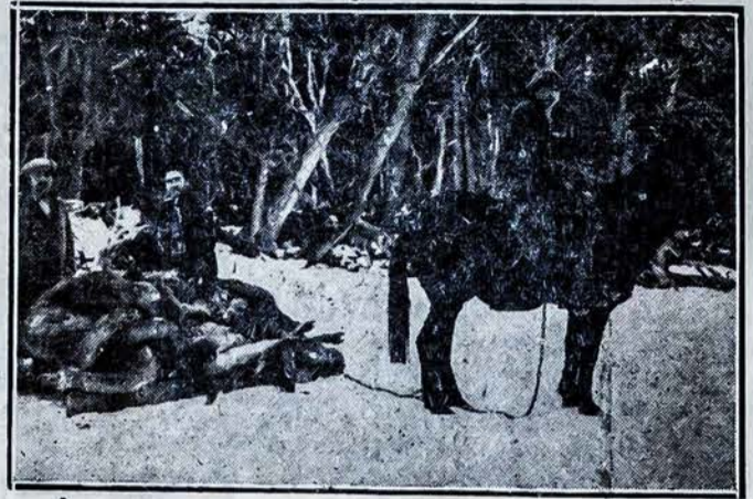
Gyvenimas Argentinos Laukuose.