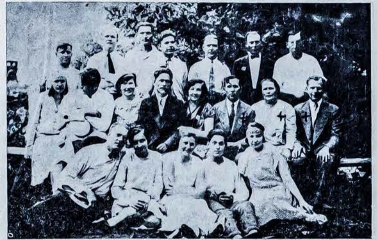
D-jos „Lietuva“ narių būrelis su Tukumano d-jos „Lietuva“ skyriaus atstovais, kurie pažymėti kryželiais.

Tada mudu su berneliu vieškelėliu važiuosim, važiuosim, važiuosim, Kaip malūne ant akmens geltoni kviečiai sužels, kviečiai sužels, Tada mudu su berneliu bažnyčioje vinčiavos, vinčiavos, vinčiavos, Nužalau, nuvargau, po lašais stovėjau, Aš į savo bernučelį išsišiepęs žiūrėjau, Nors tu gerk pasigerk, tik ant ma- nės nesibark, nesibark, nesibark, Aš tau jauna nesisiūlav, nei varde- lio nesakau, nesakau, nesakau, Nors tu manęs nežinai, bet vardeliu vadinau, vadinau, vadinau, Ir į margą gromatėlę pavardėlę įrašei. Liaudies daina