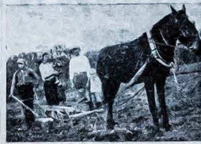
Lietuvos Robinzono upės Paranos salose.

tuviškose dainose apdainuojama gamtos gražumas, žemės ūkio darbai, jaunimo meilė ir liaudies kovos su Lietuvos užpuolikais. Lietuvos dainose moterys visur minimos tik darbininkės, šienelio grėbėjėlės, linelių rovejėlės, drobelių audėjėlės, žlugtelio skalbėjėlės ir t.t. Man rodos, tokius darbus dirbanti žmonės jau tik nėra užsipelnę „buržujų“ vardo. Dabar pažvelgsime į taip labai nekurį niekinamą mūsų tautos himną „Lietuva tėvynė mūsų tu didvyrių žemė“. Ir ten jokie buržuazizmo nerashme. Juo įvertinama mūsų bočių nuveiktus darbus. Saukiama vienybėnėjimui vien dorybės takais ir dirbimui savo naudai ir žmonių gerbei. Trokštama, kad šviesa ir tiesa mus žingsnius lydėtų. Toks kilnus yra mūsų tautos himnas. Jis yra pilnai demokratiškas ir be religinės spalvos, nei vienur neminama ir neaukiama jokių dievų pagalbos. Tokį himną netik turim gerbt ir giedoti savo tautinėse iškilnėse, bet reikėtų supažindinti su juo svetimtaučius, išvertus vietinėn kalbon ir patalpinus labiau išsiplatinusiu spaudon. Nes himnas pasako tautos kilnumą ir idejas. Tuomet nebūtume, kaip kad dabar dažnai lyginami prie azijatų, bet prie kultūringų tautų emigrantų. „Rytojas“ puolimas vaidinimų iš senovės lietuvių gyvenimo ir be pagrindo, nes vaidinti vien iš darbi-