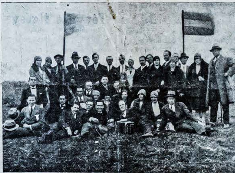
* * * Eskursijos dalyviai į Argentinos lietuvių Tautos Namą žemę. * * *