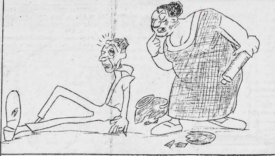
II. MAŽUČIAI "MEDAUS MĖNESIO NESUSIPRATIMĖLIAI"...

LIETUVOS PAVASARIS. Kai pavasaris ateina Užiantis ir umas, Tai gantoje kyla vaina Kyla neramumas. Žvirblis mušas su varnėnu, Rudis piauna katę, Kad kas eity kur iš vieno Mes dar nesam matę. Pažiūrėkim nors į gaidį, Tikras generolas... Visumet jausmai palaiddi, Ant visų jis puola. Štai, per žiemą sau gyveno Jonas su Maryto... Dabar šaukia: "Ach tu mano, Kas gi mums daryti?" Jonas Marės nebežiūri, Marė metė Joną. Kožnas sėd po naują turi, Kožnas jaučias ponu... Su Pilsuckiu Voldemaras Žiemą darė taikę Dabar velnias žin kas daros Darnai gaištę laikę. Ūpas pas visus karingas, Jėgas tik mōgina, Kam derybos reikalingos Dievas viens težino. Žodžiu mums tai aiškiai jaučias Sunki atmosfera. Nepadės mums Karaliaučius, Tol kol Vilniaus nėra. Mat parinktas laikas blogas - Žino tai kiekvienas žmogus, Tik vadai pamiršo.