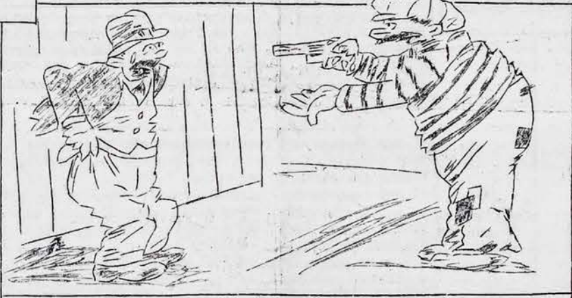
KRITINGA PADĖTIS. Plėšikas: - Kelk rankas aukštyn! Užpultais: - Negaliu, ponui, petnešos neužsegtos!

IŠMOKO IŠ "KUNIGO".... Tėvas rengdamasi mušti savo septynių metų berniuką, kuris labai pradėjo keiktis ir bauriai koliotis sako: - Pasakyk iš kur tu tai visa išmokai, tai per pusę bausmę sumažinsiu. - Nemušk tėveli, tuoj pasakysiu. - Na, tai sakyk! - Iš kunigo. - Iš kokio kunigo? - mustobęs paklausė tėvas. - Iš to ką per "Rytojaus" parėnginę į kurį aš buvau slapčia pusvalandžiui nubėgęs pamokslą sakė - atsakė vaikas.