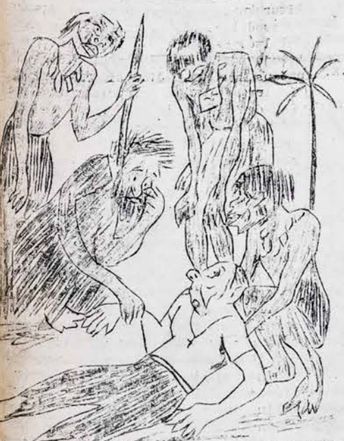
ŠIO SVIETO NELYGYBĖ, ARBA NESIŽENYK UŽ SAVE DRŪTESNĖ BOBĀ...