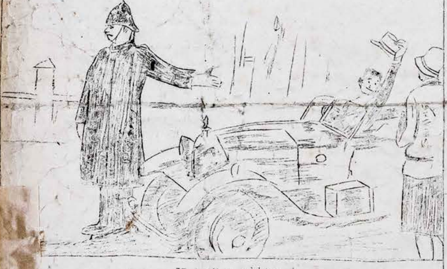
II 1927 m. aktas.