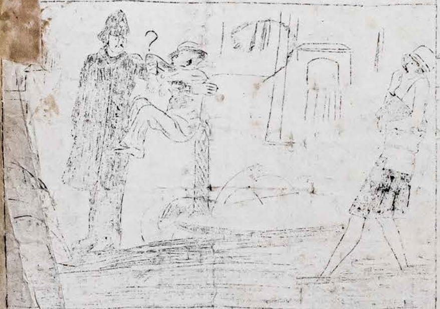
192 m. prieš didįjį seimo ar referendumo klausimą.

GATVĖS NUOČIKIAI ARBA LIETUVA TRIJUOSE AKTUOSE.